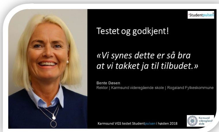
Karmøy VGS var en av de første som bestilte. De har brukt oss siden 2018. (Se film på infoREGI.no/studentpuls )

Ja, med jevne mellomrom sender vi deg en epost med oppdateringer. Planer og status. I tillegg får du en oversikt over forestående merkedager . Vi tilbyr også en enkel workshop online med opplæring i bruk av infoskjermen.